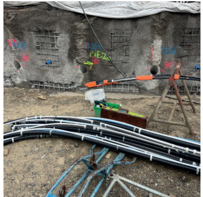
carottage des pieux de la paroi pour permettre le forage des tirants d'ancrages. (photo de gauche)